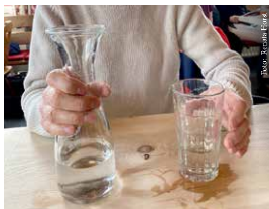
Abbildung 4b: Das Glas steht mit der Öffnung nach oben und wird mit Schulteraußenrotation, Unterarmsupination und Dorsiflexion der Hand gegriffen (10).