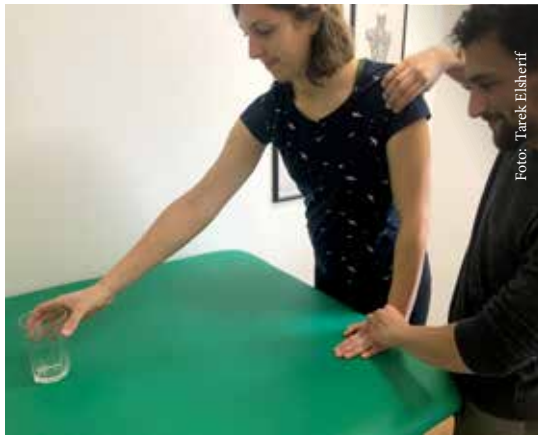
Abbildung 6a: Wichtig ist, die Therapie innerhalb relevanter und sinnvoller Kontexte für das Individuum zu gestalten.

gleiten, um die Dorsalextension im Handgelenk zu fördern. Mit seiner proximalen Hand übt er einen Längszug für die ventrale Kapsel aus und appliziert Druck über die Sehneninsertionen in Richtung Gelenkpfanne. Hierdurch wird die Rotatorenmanschette automatisch aktiviert (siehe Abbildung 6a).