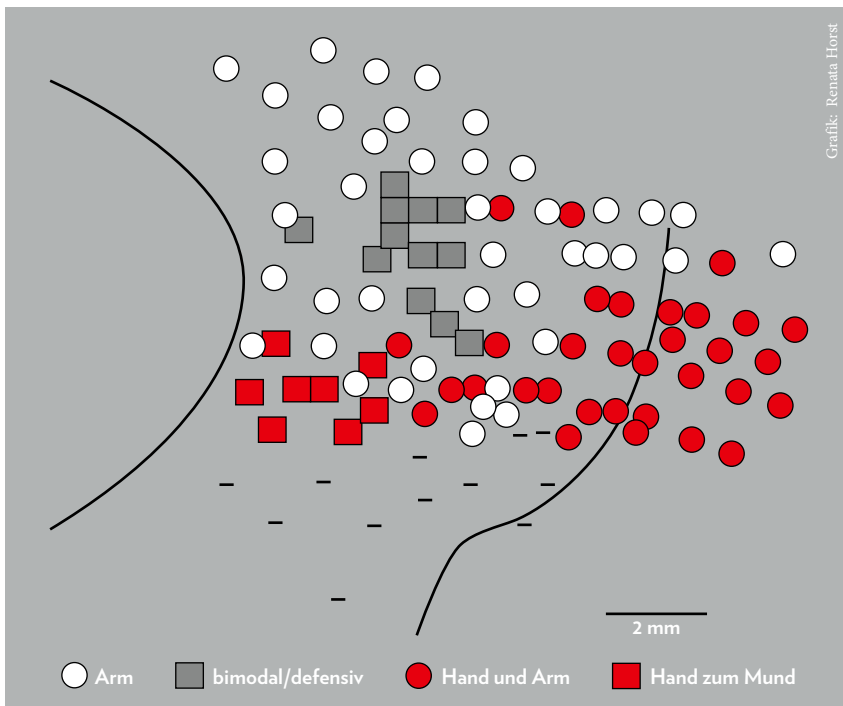
Abbildung 2: Kortikale Repräsentation. Körperteile sind im Kortex in aktivitätsabhängigen Verbänden mosaikartig repräsentiert. Dieselbe Bewegung erfordert je nach der Aktivität, bei der sie vorkommt, die Vernetzung unterschiedlicher Neuronen (9, 10).

Die Augen-Hand-Koordination sowie das Zusammenspiel zwischen dem vestibulären und propriozeptiven Systems (vestibulo-spinale Reflexe) müssen organisiert werden, um die unbewusst gesteuerte