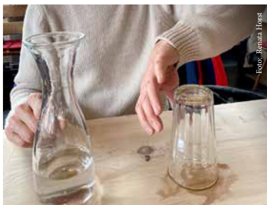
Abbildung 4a: Aufgabenorientierte Koordination. Das Glas steht mit der Öffnung auf dem Tisch und wird mit Schulterinnenrotation, Unterarmpronation und Handvolarflexion gegriffen (10).

Im Zuge der neurologischen Rehabilitation, in welcher das motorische Lernen erzielt werden soll, müssen Alltagsaktivitäten trainiert werden.