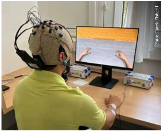
Abbildung 1: Therapiesituation mit einem Brain-Computer-Interface.

Für die Organisation von Alltagsaktivitäten, um adäquate Lösungen für die jeweilige Handlung zu ermöglichen, bedarf es der Interaktion zwischen Perzeptions- und Aktionssystemen.