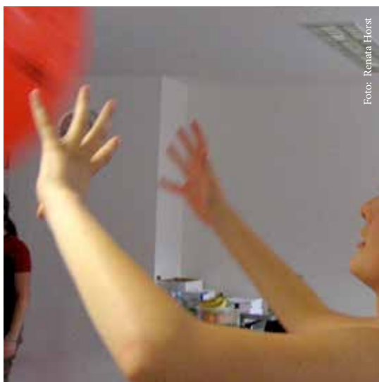
Abbildung 5b: Beim Ballprellen sind Hand- und Fingerstreckung der Situation koordiniert angepasst.

Erfolge gesehen habe und jedes Mal danach meine Haare waschen musste.“