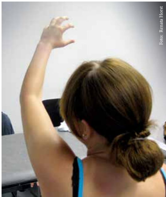
Abbildung 5a: Fokale Dystonie. Ohne Kontext sind Hand- und Fingerstreckung verkrampft.

MK: „Erschöpft, weil es so lange gedauert hat und es relativ anstrengend war, sich dabei immer wieder eine Bewegung vorzustellen. Genervt, weil ich keine