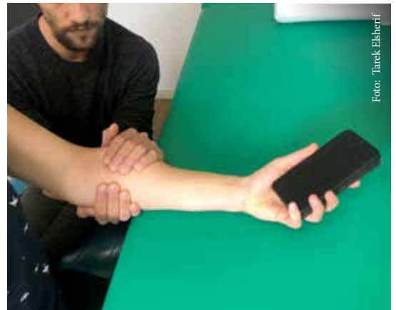
Abbildung 6b: Übungen, welche direkten Bezug zu alltäglichen Aktivitäten haben, liegen innerhalb dieser relevanten und sinnvollen Kontexte.